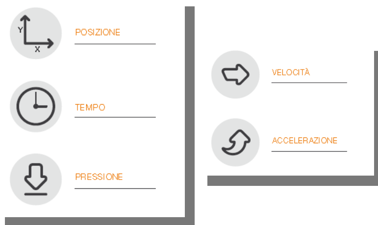
Fig.1 - Schema

E' possibile elaborare velocità e accelerazione ai fini di analisi forensi.