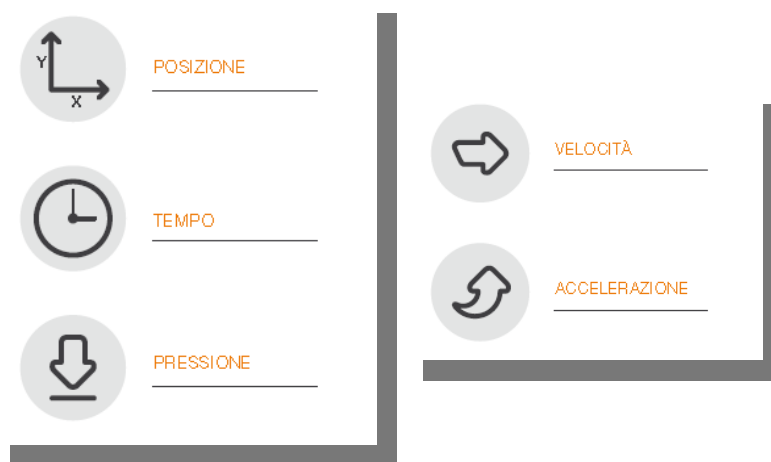
Fig.1 - Schema

E' possibile elaborare velocità e accelerazione ai fini di analisi forensi.