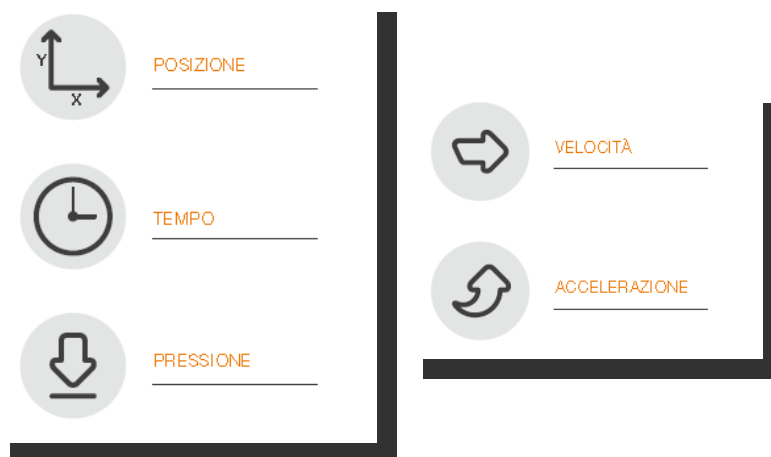
Fig.1 - Schema

Gli elementi disponibili nell'apposizione della sottoscrizione da parte del FIRMATARIO , sono i dati biometrici e comportamentali, quali: Posizione della penna, Pressione, Tratto in aria (percorso che fa la penna quando non tocca nel device, fino a 1cm ), e Tempo. E' possibile elaborare velocità e accelerazione ai fini di analisi forensi.