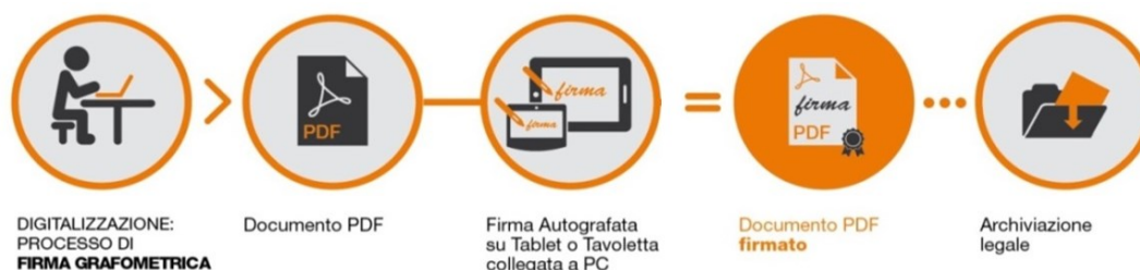
Fig.2 - Schema

I dati cifrati vengono successivamente inseriti nel pdf attraverso la creazione di una firma conforme allo standard europeo denominato PAdES. La soluzione prevede che, a sigillo di ogni firma apposta sul documento dal CLIENTE, sia applicato un certificato rilasciato da NAMIRIAL CA.